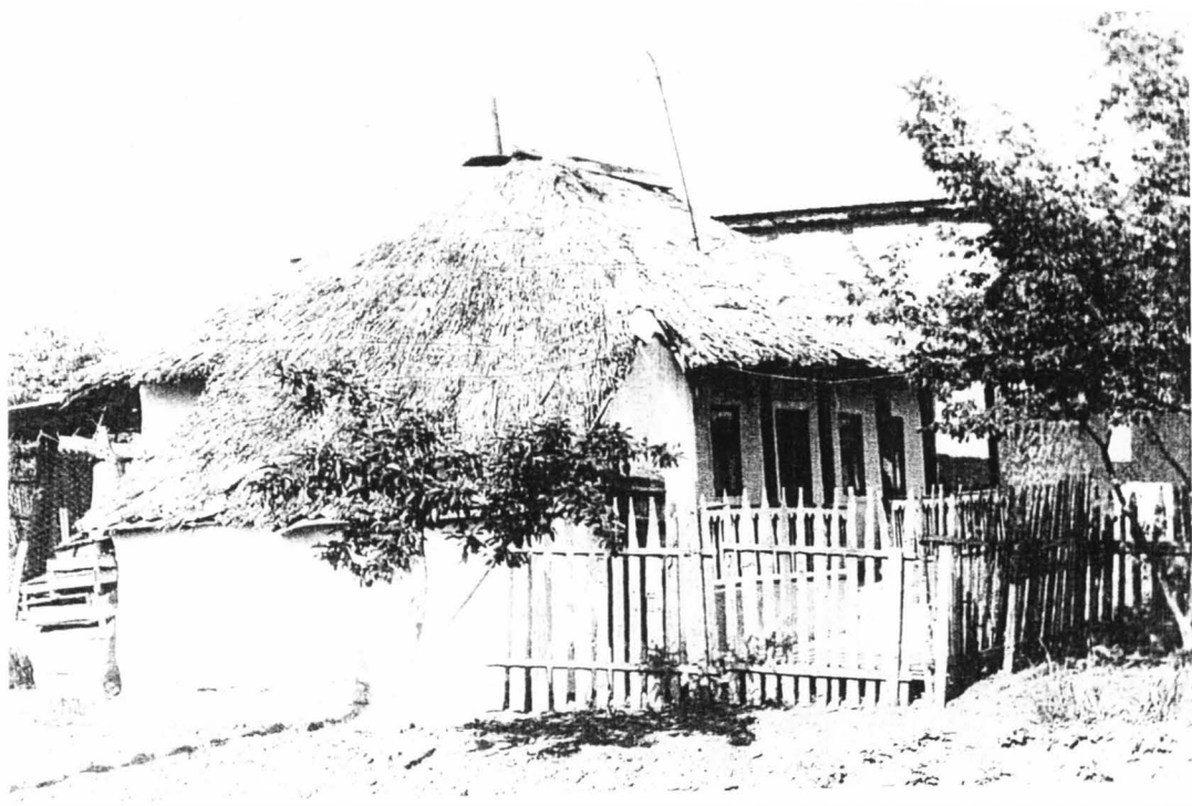
Casă veche din satul Hârtopi (Criuleni)