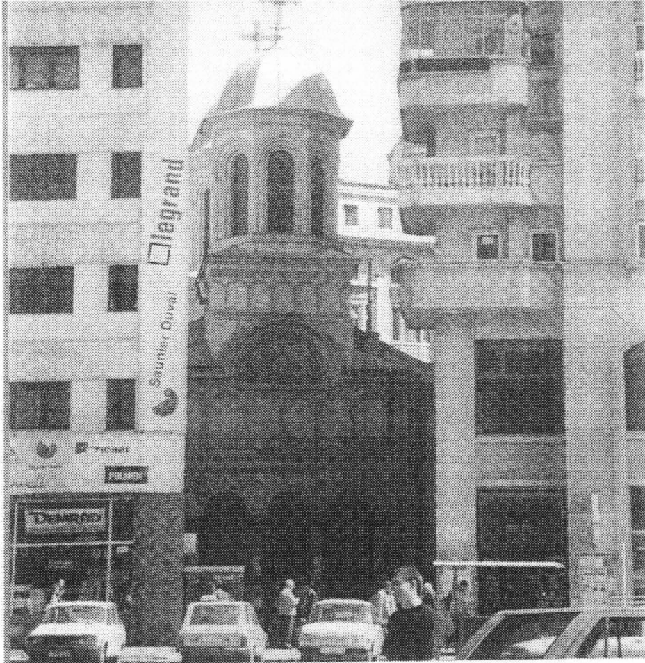
Biserica Sfântul Ioan cel Nou, deplasată în 1986 și mascată de blocuri.